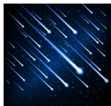
13日 14日 流星群