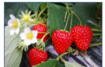
苺の花って白いんだ

お知らせ ◇懇談会 相談会 学習のこと 生活面のことなど ご希望がありましたら お知らせください。普通日の午前9時～午後3時を基本として 日程は相談させていただきます。