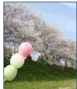
花より団子 (だんご)