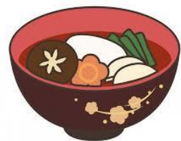
おもち焦げ目をつけたいなあ

★お知らせ : 中学校 高校合格判定テスト 1月(1500円) ご希望お知らせください。