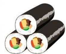
信州でも恵方巻 いつからかなあ

★お知らせ : 中学校 高校合格判定テスト 1月分 2月分 (1500円) ご希望お知らせください。