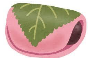
ひな祭り 月遅れ ワニゴン村

☆ 月ごとの学カテスト（4月分） 中学・高校合格判定テスト（1600円） ご希望をお知らせください。